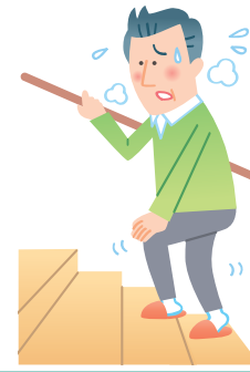
階段の上り下りで息切れする