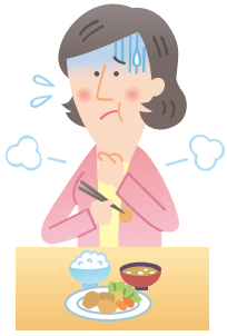
食べ物が飲み込みにくい