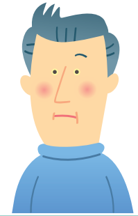
皮膚や目の色が黄色い