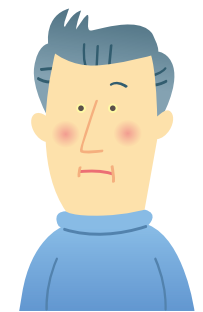
皮膚や目の色が黄色い