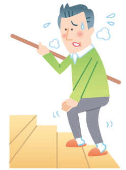
階段の上り下りで息切れする