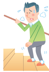
階段の上り下りが辛い